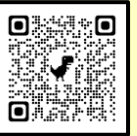
色イロリトミック 申込専用フォーム