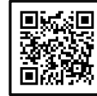
子育てミニ講座申 込専用フォーム

【申込】5月7日(水)9:30~ 申込専用フォームに必要事項を 入力してお申込みください。 定員になり次第しめきります。