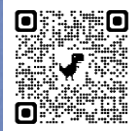
Little Cocoon (ハロウィン)