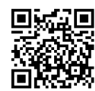
育児講座 (音あそび)