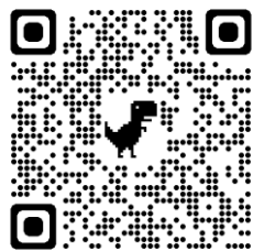
ママにおすすめ エクササイズ