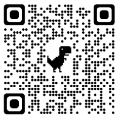
色イロリトミック