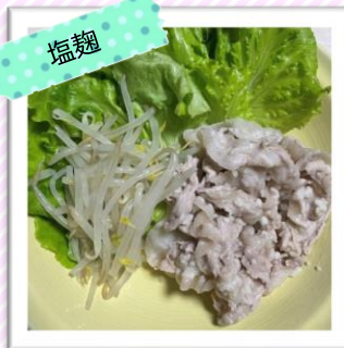
豚しゃぶの塩麴和え