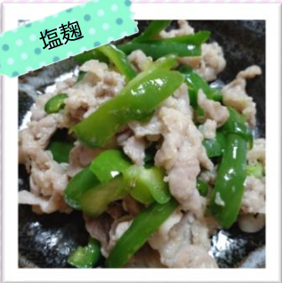
豚こまとピーマンの塩麴炒め