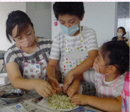
家族で力をあわせて 塩麴・醤油麴を仕込みました。 美味くなあ～れ～♪