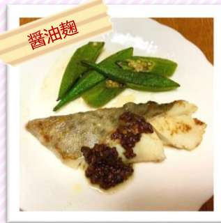
たらの醤油麴バターソース添え