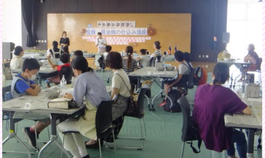
会場は多目的ホール。14組の親子が参加しました。