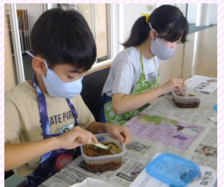
材料が麴によくなじむよう しっかりとかき混ぜました。