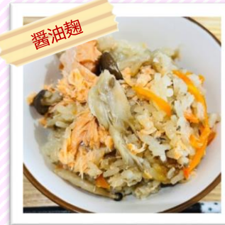
キノコと鮭の 秋味炊き込みご飯