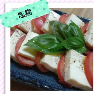
豆腐の塩麴カプレーゼ風