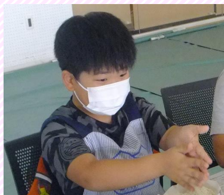
麴を「てのひら」でバラバラにしました。 はじめて触る麴の温かさを感じました！