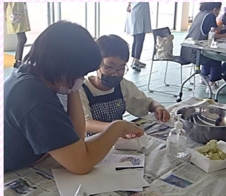
親子で協力しながら、 麴の仕込みを行いました。