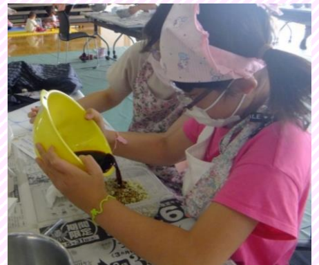
こぼさないように慎重に！