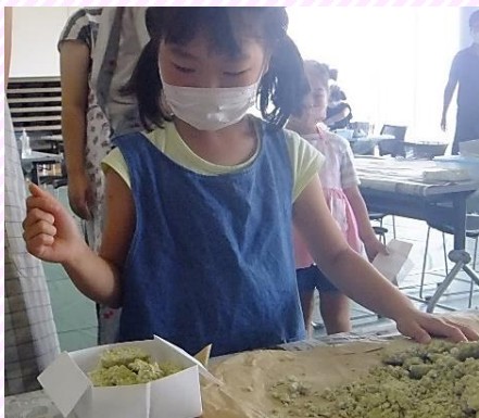
材料(麴・醤油・塩・水)の計量から 自分たちで丁寧にを行いました。