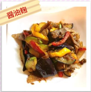
豚肉とナスパプリカズッキーニの 醤油麴炒め