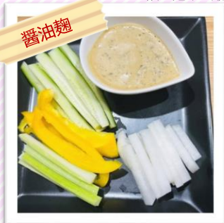
野菜スティックの ディップソース