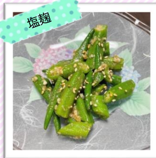
オクラの塩麴胡麻和え