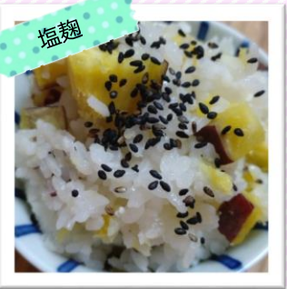
塩麴のさつまいもご飯