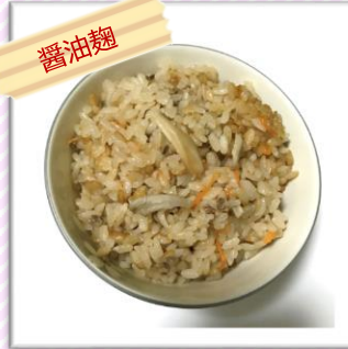
醤油麴とまいたけの 炊き込みご飯